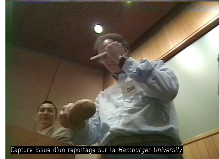
Capture issue d'un reportage sur la Hamburger University