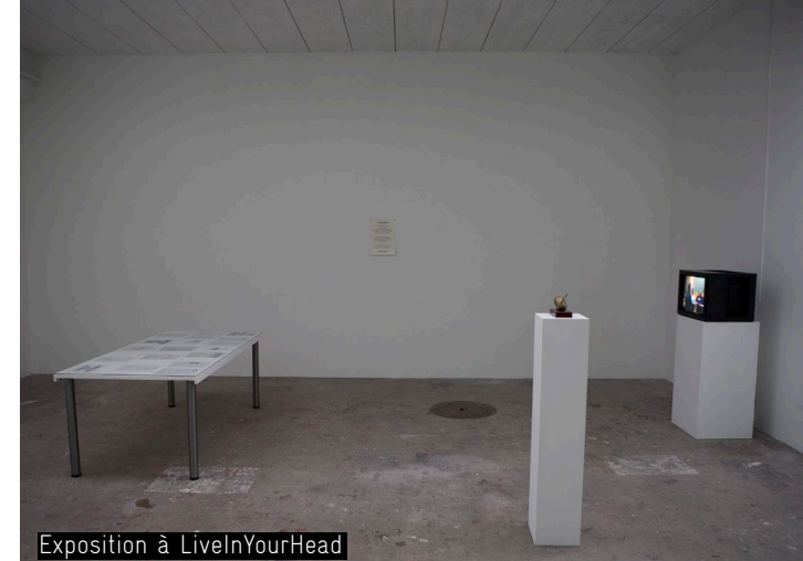
Exposition à LiveInYourHead

Par cette pièce, c'est l'expansion et la banalisation de la privatisation des études – notamment dans le contexte des études en art – qui étaient questionnées. L'un de ses principaux enjeux a été de mettre en relation, au travers de ce projet, les étudiants de l'Université et ceux de la Haute École d'Art et de Design. L'utilisation de l'espace d'exposition comme un lieu de rencontre où les personnes impliquées discutaient de stratégies concrètes à adopter pour lutter contre l'application des mesures néolibérales dans l'éducation, était un moyen de produire un contenu politisé qui puisse retourner dans la sphère publique, sans être totalement neutralisé par l'institution artistique.