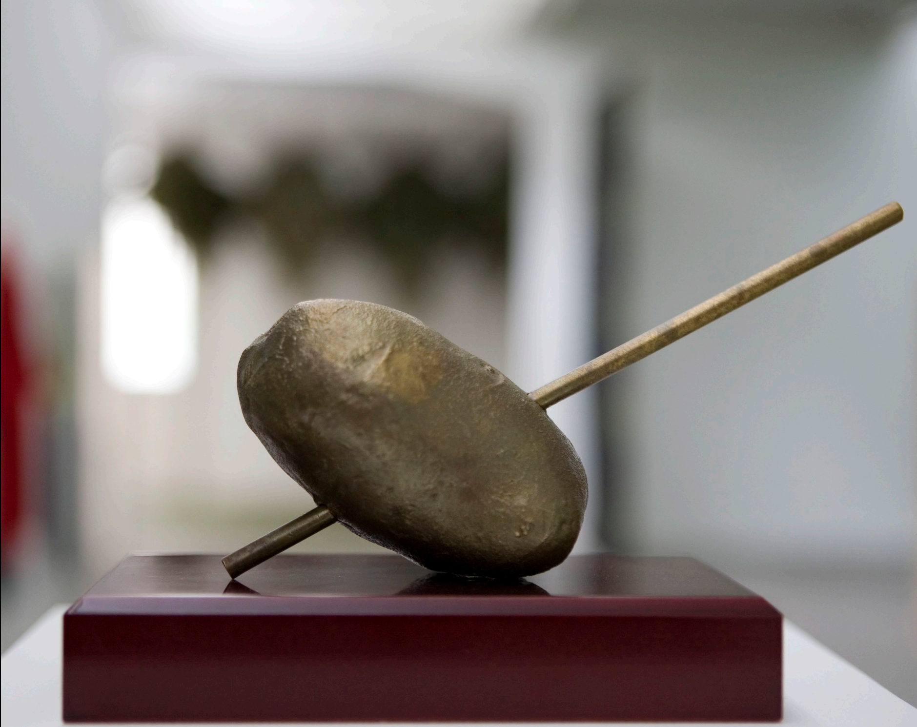
Trophée inspiré d'un séminaire de la Hamburger University